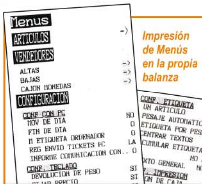
Impresión de Menús en la propia balanza