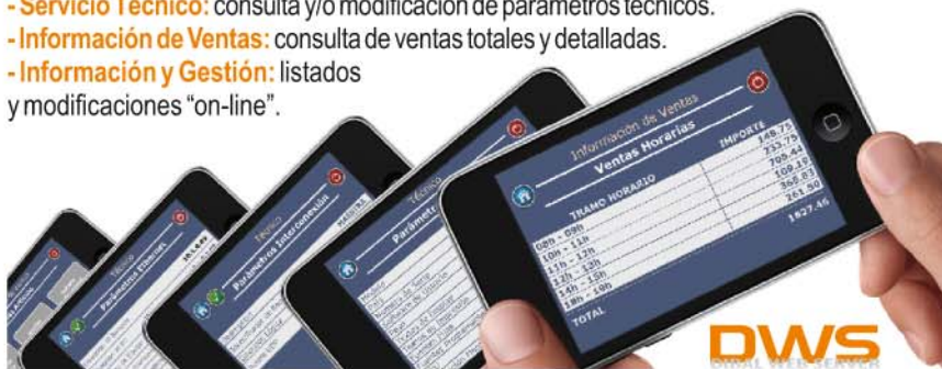
Tabla de Modelos

OPC. = Opcional. * Utilizando la tecla Shift y las de Vendedor. ** Excepto en formato Colgante ABS.