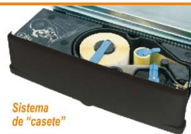
Sistema de "casete"