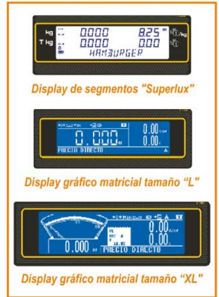
Display de segmentos "Superlux"